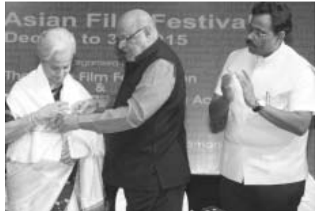
वहिदा रेहमान, श्याम बेनेगल व सांस्कृतिक कार्यमंत्री विनोदजी तावडे

१४व्या थर्ड आय आशियायी महोत्सवाच्या उद्घाटन सोहळ्यात अभिनेत्री वहिदा रेहमानला रुपेरी पडद्यावरील सहज अभिनय नैपुण्याचा पुरस्कार दिग्दर्शक श्याम बेनेगल यांच्या हस्ते प्रदान करण्यात आला. अध्यक्ष स्थानी सांस्कृतिक कार्यमंत्री विनोदजी तावडे होते.