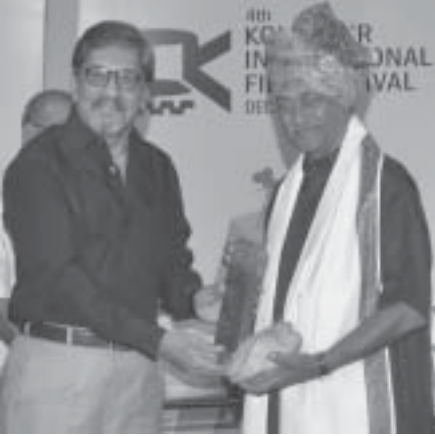
अमोल पालेकर - गिरीश कासारवल्ली

कोल्हापूर : कलामहर्षी बाबूराव पेंटर फिल्म सोसायटीचा ४था कोल्हापूर आंतरराष्ट्रीय चित्रपट महोत्सव १८ ते २५ डिसेंबर या सप्ताहात शाहू स्मारकमध्ये भरला होता.